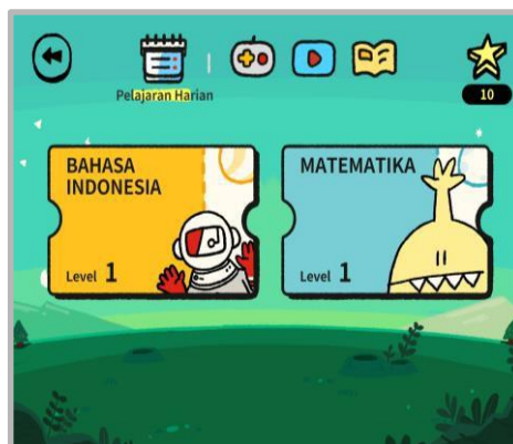
Layar utama Sekolah Enuma

Sekolah Enuma Indonesia (SEI) merupakan aplikasi digital berisi ratusan kegiatan belajar dalam bentuk permainan, buku, dan video yang digolongkan ke dalam beberapa alur pembelajaran tertentu, sehingga anak-anak dapat mempelajari Bahasa Indonesia, Matematika, dan Bahasa Inggris dengan cara yang paling efektif. Sistem ini dirancang agar sesuai untuk masing-masing anak, sehingga proses belajar tiap anak menyesuaikan tingkat pembelajaran yang tepat untuk mereka.