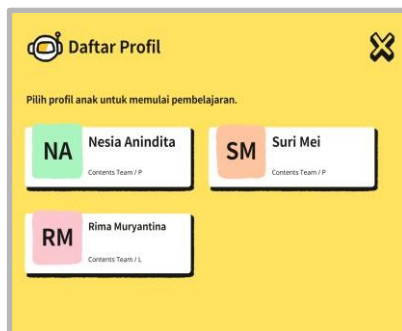
Layar Pilih Profil di Aplikasi Sekolah Enuma